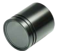
VISOR®용 C 마운트 보호 하우징