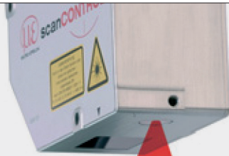
와이퍼 블레이드 고무를 비추는 레이저 라인