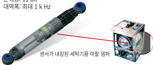
센서가 내장된 세탁기용 마찰 댐퍼