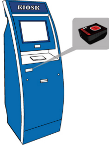
공항 셀프 체크인 키오스크