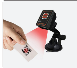
오토 스캐닝 & 센싱