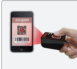
모바일 쿠폰 조회