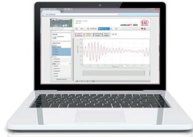
모든 설정은 웹 인터페이스에서 수행됩니다. 내용은 확장가능한 데이터 베이스 상에 저장됩니다.

사용자 중심의 웹 인터페이스로 인해 제어기 및 센서의 전체 구성 프로세스는 추가 소프트웨어를 사용하지 않고 수행되며 데이터 출력은 이더넷, EtherCAT, RS422 또는 아날로그 출력을 통해 이루어집니다.